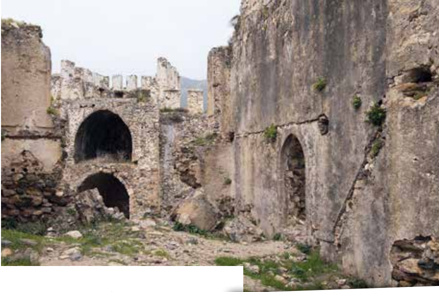
Deniz kıyısındaki 23 bin 500 metrekarelik görkemli alanıyla ünlenen Mamure, Türkiye'nin en büyük kaleleri arasında yer alıyor.