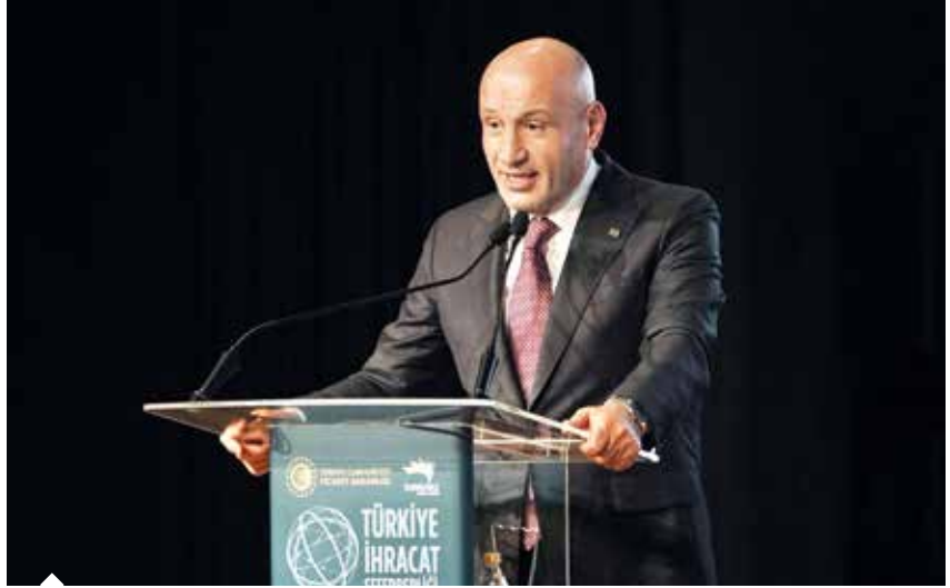
TİM Başkanı Gültepe, "İhracatta kilogram birim fiyatımız 1,5 dolar seviyesinde, kısa vadeli hedefimiz bunu 2,5 doların üzerine çıkarmak. İnovatif ürünlerle bunu yapabiliriz." dedi.

Türkiye İhracatçıları Meclisi (TİM) Başkanı Mustafa Gültepe ise konuşmasında küresel ekonomilerde yaşanan daralmaya dikkati çekti. 27 sektörde 61 ihracatçı birliğinin üstün gayretleriyle ilk 4 ayda ihracatta yüzde 2,7'lik artış sağladığını belirten Başkan Gültepe, "Dünya ekonomisinde yaşanan savaşlar ve sıkıntılarının olduğu bir ortamda Türkiye ihracatçıları olarak böyle bir sonuca imza attığımız için mutluyuz. Bu yıl 267 milyar dolar, 2028'de ise 375 milyar dolarlık mal, 200 milyar dolar da hizmet ihracatı hedefimiz var. Özellikle ihracatın yüzde 45'ini yaptığımız Avrupa Birliği'ndeki daralmalar bizi yakından ilgilendiriyor. Türkiye ihracatçıları olarak geçen yıla göre sektörlerimizle yüzde 5'in üzerinde artış sağla-