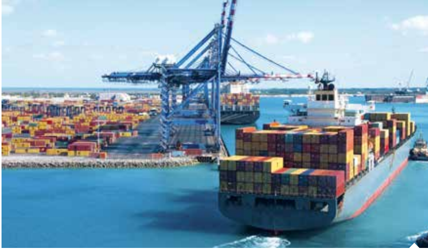
AKİB, 24,1 milyar dolarlık ülke ihracatına yüzde 7,9 oranında destek verdi.

Akdeniz İhracatçı Birlikleri (AKİB), mayıs ayında geçen yılın aynı dönemine göre yüzde 35 oranında artış sağlayarak 1 milyar 646 milyon dolar ihracat gerçekleştirdi. AKİB, ihracat hacminde en güçlü ivmelenmeyi Malta, Slovenya, Hollanda, Yunanistan, ABD ve İtalya pazarlarında elde etti.