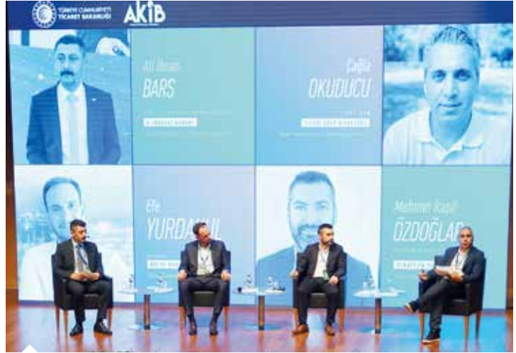
Mersin E-İhracat Zirvesi’nde gerçekleştirilen oturumlarda dijital ticarete önde gelen sektör temsilcileri bilgi ve deneyimlerini paylaştı.

Başarı için müşteri odaklı çalışıp ihtiyaçlarının doğru tespit edilmesi ve gelecek trendlerin takip edilmesinin riski azaltılabileceğini ifade eden Önal, ardından bu alanda verilen devlet desteklerini aktardı. Ticaret Bakanlığı sitesinden detaylı bilgilere ulaşılabilceğini kaydeden Önal, 18 hedef ülke belirlendiğini ve bu ülkelere e-ticaret için kılavuzlar oluşturulduğunu dile getirdi. Bu kılavuzlarda hangi pazarda hangi sosyal medyanın ağırlıklı kullanıldığından hangi dijital ödeme sistemlerinin kullanıldığına ve gümrük maliyetlerine kadar her türlü detayın bulunduğunu belirten Önal, ayrıca Amazon, Otto, Etsy, Zalando gibi pazaryerlerine, Google, Meta, Criteo gibi sosyal medya ve arama motorları-