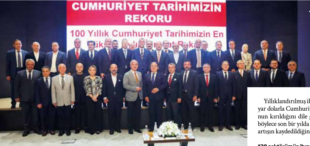
Ticaret Bakanı Ömer Bolat, Mayıs ayı dış ticaret rakamlarını TİM'in kurmaylarıyla birlikte açıkladı.