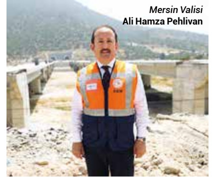
Mersin Valisi Ali Hamza Pehlivan

Büyükeceli-Gözce etabındaki 13 kilometrelik tünelin yaklaşık 8 kilometresindeki betonlama çalışmalarının yıl içinde tamamlanacağını kaydeden Vali Pehlivan, "Akdeniz Sahil Yolu Projesi'nde